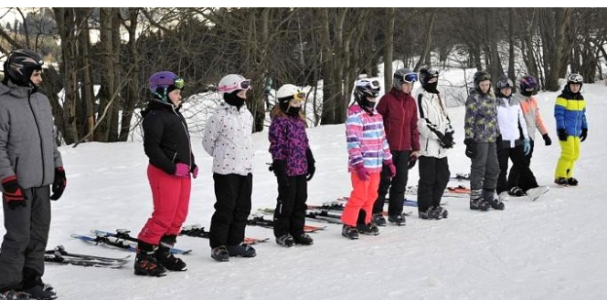
Z lyžařského výcviku.

V týdnu od 4. do 8. 2. 2019 proběhl lyžařský výcvik, který se konal jako každý rok v Jestřabí v Krkonoších v hotelu Eden. Sněhové podmínky byly ideální, celým týdnem nás provázelo sluníčko. V letošním roce bylo 49 lyžařů a 15 snowboardistů. Celý týden se intenzivně lyžovalo a na středu bylo připraveno překvapení ve formě večerního lyžování.