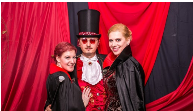
Hrabě Drákula a jeho oběti.