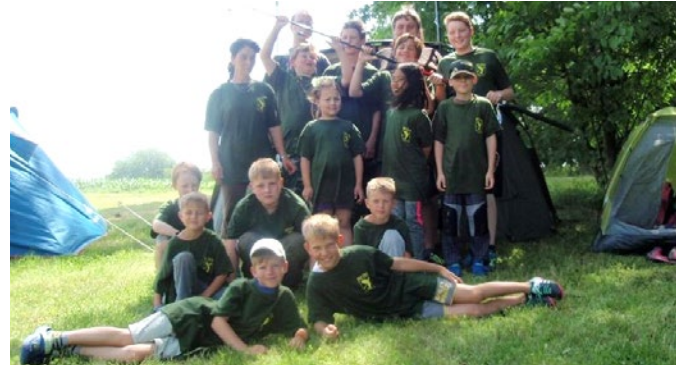
Dětský rybářský kroužek.