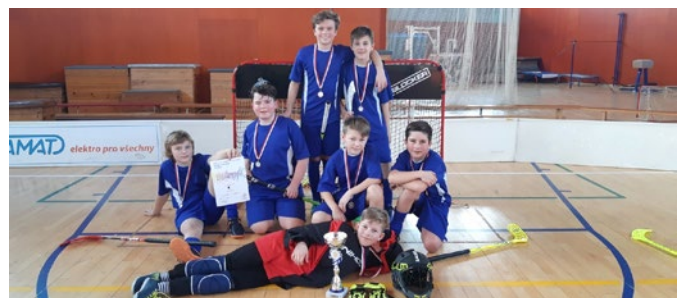
Krajské kolo ve florbalu.