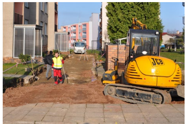
Práce na komunikaci u bytového domu.