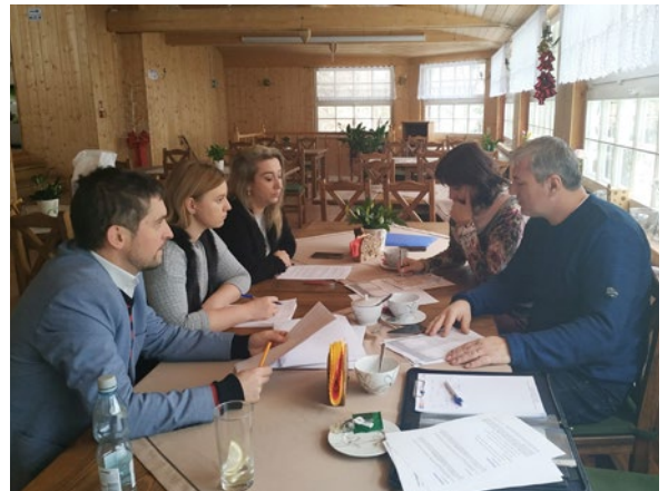
Fotografie z jednání stran.