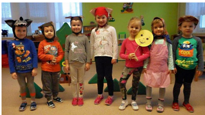
Děti při dramatizaci pohádky.

Základní škola a mateřská škola Častolovice