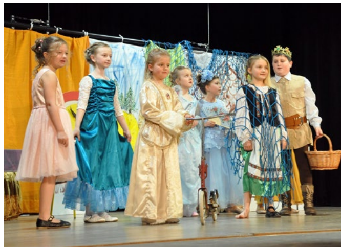
Představení Královna koloběžka v podání dětí z Olešnice.

5. dubna v podvečer proběhla již tradiční jarní akce pro děti a rodiče s názvem „Aprílové světluškování“, kterou připravil spolek SRPDŠ – MŠ Častolovice. Program začal v sále U Lva divadelním představením „Královna koloběžka“, kterou nastudovaly děti ze školy v Olešnici. Po představení děti čekal mladé účastníky a rodiče pěší výlet, při kterém děti plnily úkoly na téma pohádek. V cíli na myslivecké chatě byly děti odměněny drobnými dárky. Jako občerstvení se podával gulášek a bylo možné si opéci špekáček. Počasí bylo skvělé, teplo bylo i po setmění při návratu domů za svitu lampiónků.