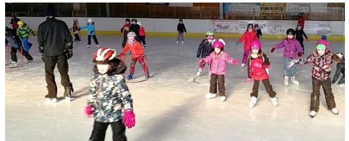
Bruslařská školička v Rychnově nad Kněžnou.

V únoru měla 1. a 2. třída možnost navštěvovat bruslařskou školičku v Rychnově nad Kněžnou. Školičkou žáky provedli instruktoři bruslení, učili je správně pokládat brusle, vstávat z ledu, bruslit v dřepu, po jedné noze a klouzat po ledu. Na konci 3. lekce už uměl každý žák základy a dokázal bruslit sám.