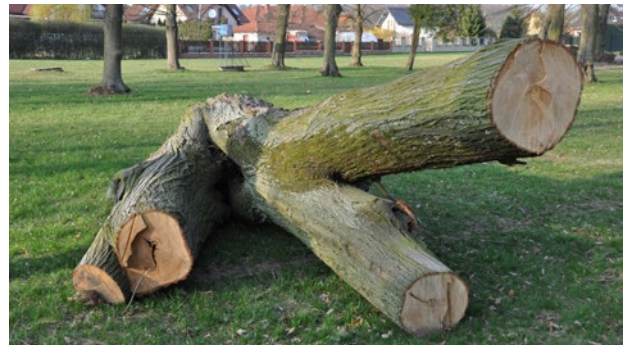
Jeden z pokácených stromů v Sokolské zahradě.

Nepochybně jste zaregistrovali, že v zimních měsících bylo provedeno kácení tří stromů v Sokolské zahradě. Důvodem pro rychlý zásah byl odborný dendrologický posudek se zcela jasným verdiktem – neprodlené skácet z důvodu bezpečnosti. Stromům totiž hrozilo rozlomení. Bohužel to v této lokalitě nebude v budoucnu ojedinělý případ. Drtivá většina stromů není v dobrém stavu. Sokolská zahrada vznikla téměř před sto lety. Tehdy ještě v okrajové části Častolovic bylo sportovními nadšenci vybudováno venkovní sokolské sportoviště. Od té doby došlo v parku jen k minimálním ozdravným prořezům a ojedinělé výsadbě. Park zestárnul. Nyní se nachází ve fázi, kdy je nutné pro jeho zachování i zajištění bezpečnosti přikročit k postupnému citlivému odstraňování problémových stromů, péstebním opatřením – ozdravným prořezům a náhradě novou výsadbou.