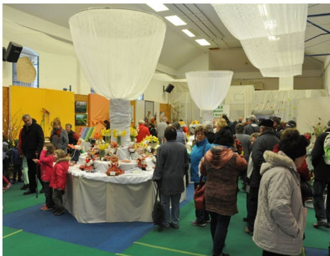
Hlavní výstavní sál

Ve dnech 12. – 14. dubna 2019 proběhla jarní zahrádkářská výstava s názvem Velikonoce – svátky jara. Pořadatelé byly ZO ČZS Častolovice, ÚS ČZS Rychnov nad Kněžnou a městys Častolovice.