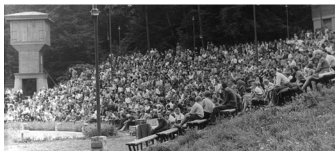
Plné hlediště areálu původního letního kina v Častolovicích.