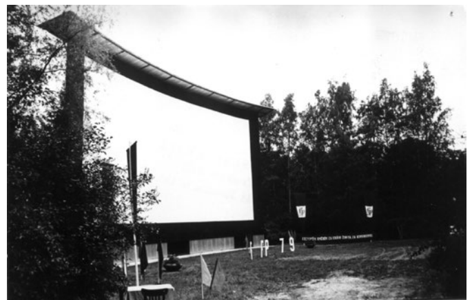
Fotografie letního kina v době největší slávy, rok 1979.

A ještě něco osobního. Píše se rok 1991 a do kin přichází film Jana Svěráka Obecná škola. Podařila se nám neskutečná věc. Tento film se u nás promítal ve světové premiéře, ale to nebylo vše. Jako host přijel Zdeněk Svěrák s manželkou. Jako scénárista filmu byl zvědav na reakci návštěvníků a nebyl zklamán, zaplněné hlediště bouřlivě aplaudovalo jak příběhu, tak i výkonu herců. O kvalitě svědčí i nominace na Oscara za nejlepší zahraniční film.