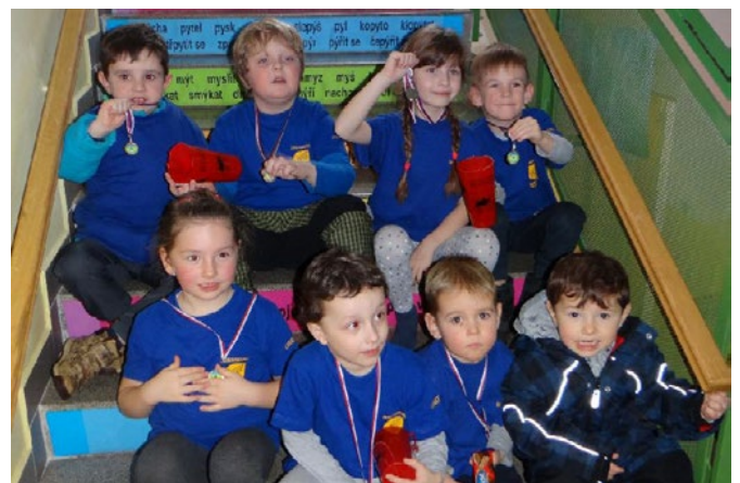
Mladí dekorovaní sportovci.

Dne 26. 1. 2019 se 7 dětí z oddílu Sokola Cvičení rodičů s dětmi účastnilo prvního ročníku soutěže „Újezdecký šestiboj“. Pořadatelem celé akce byl Bílý Újezd – SPV Opočno a SDH Bílý Újezd. V soutěži bojovaly 4 oddíly. Děti byly rozděleny do sedmi kategorií. Soutěžilo se v těchto disciplínách: překážkový běh, skok z místa, hod míčem, přitahování na lavičce, skládání kelímků a skákání panáka.