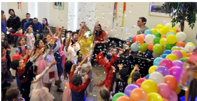
V narvaném sále panovala při karnevalu skvělá nálada.