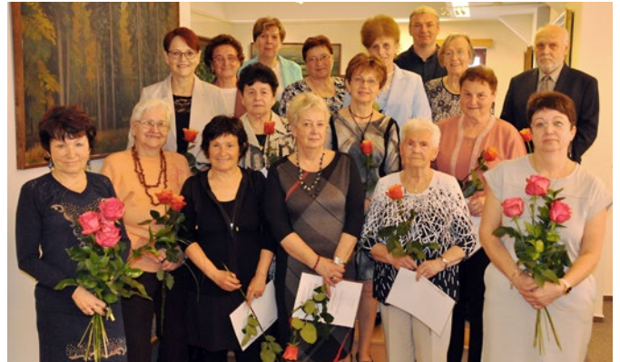
Absolventi zimního semestru 30. 3. 2019 po předání pamětních listů v Hudečkově galerii.

Slavnostní předávání pamětních listů zimního semestru 2017/2018 (téma Cestování – co jste možná nevěděli) se konalo v sobotu dne 30. 3. 2019 v Galerii Antonína Hudečka.