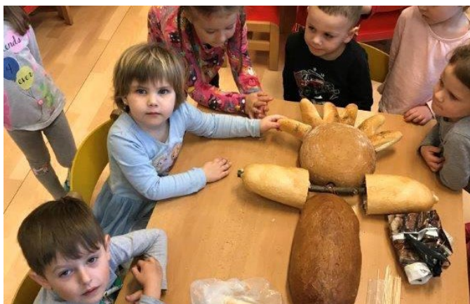
Děti vyrábějí Moranu.

V rámci podtématu Bylo-nebylo jsme si s dětmi vyprávěli pohádky s dětskými hrdiny i pohádky o zvířátkách a jednu jsme si i zdramatizovali. Na Koblížka měl chuť nejenom dědeček, ale také některá lesní zvířátka. Nakonec si na něm pochutnala liška Lucinka.