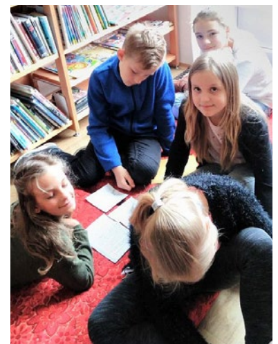
Čtenářský maraton.

V pondělí 25. března a ve středu 27. března se v knihovně sešly děti z 1. stupně častolovické základní školy. Rozdělily se do skupinek, kde jim byly rozdány obálky, ve kterých našly výstřižky z textu – ukázky z určité dětské knížky. Jejich úkol spočíval v pečlivém přečtení a poté seřazení tak, jak text následuje, a stručné převyprávění obsahu ukázky. Pro 1. třídu jsme měli přípravnou dětskou knížku, ze které jsme jim četli příběh. Nakonec si děti prohlédly dětské knížky, jež mohou v knihovně nalézt, a že jich nemá málo! Ty, které je zaujaly, si odnesly domů. Zájem byl veliký.