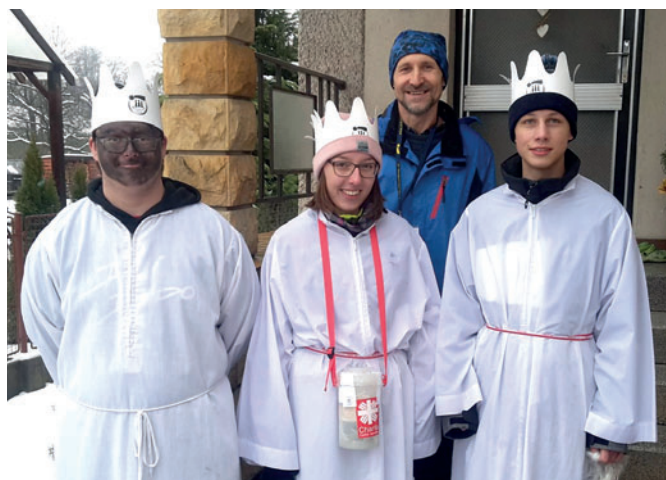
Tradiční tříkrálová sbírka se konala v sobotu 5. ledna 2019.