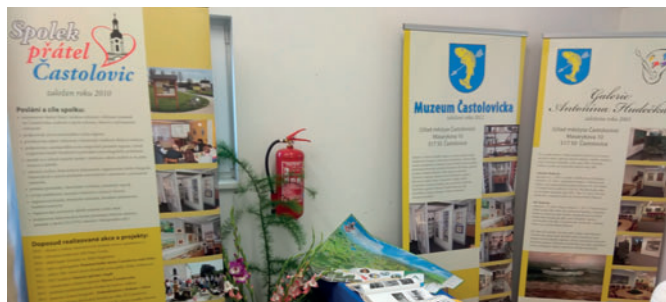
I spolek měl na výstavě své čestné místo.

Spolek přátel Častolovic se ve dnech 4. – 7. října podílel na přípravě koutku městyse Častolovice pro podzimní zahrádkářskou výstavu Radost – krása – užitek.