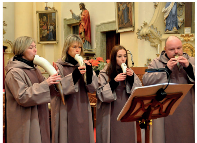
Skupina Solideo z Děčína navodila tu pravou adventní náladu.

Následně byl v prostorách kostela sv. Víta uspořádán od 16 hodin adventní koncert. Vystoupila na něm hudební skupina Solideo z Děčína. Čtyřčlenné uskupení hudebníků zazpívalo a postupně i zahrálo na pětadvacet dobových nástrojů hudbu šesti století. Vystoupení navodilo tu pravou adventní náladu, ale bylo i veselé díky vtipnému doprovodnému slovu kapelníka. Akce pořádaná kulturní komisí měla poměrně dobrou návštěvnost, dostavilo se na ní přibližně padesát diváků.