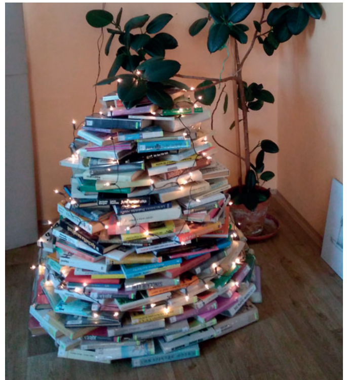
Příjemnou pohodu při správné volbě počteníčka vám přeje knihovnice

Všem lidem dobré vůle přejeme pokojně strávené svátky vánoční, v novém roce spousta elánu, zdraví a spokojenosti. Zachovejte nám přízeň i v letech nadcházejících.