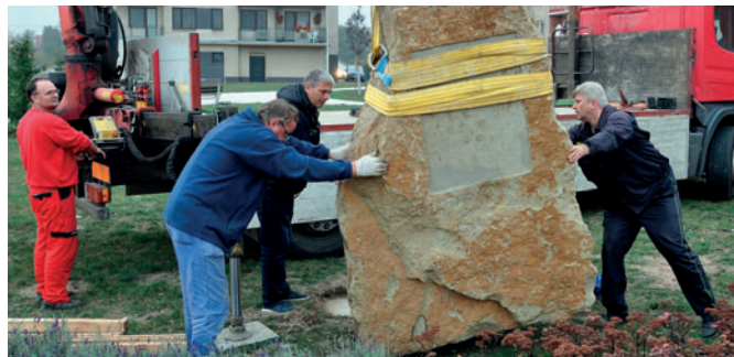
Kamenný monolit umístěný v lesoparku přivezli ze Záměle.

V pátek 19. října spolupracovali členové spolku a členové JSDH Častolovice na přepravě objemného nákladu – pískovcového monolitu o váze přibližně pět tun z kamenolomu pana Sršně ze Záměli do parčíku u častolovického hřbitova. Tam byla v předvečer 100. výročí založení Československé republiky odhalena pamětní deska padlým a umučeným rodákům a spoluobčanům v obou světových válkách. I přes velkou náročnost a komplikace dopadla celá akce na výbornou.