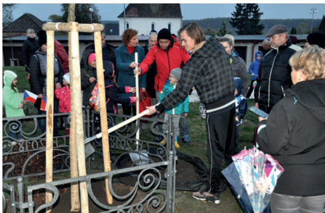
Přítomní mohli symbolicky vyjádřit svůj podíl na výsadbě.

Všichni přítomní mohli ke stromku přihodit svůj díl zeminy a vyjádřit tak symbolický podíl na výsadbě. Od kamene vyrazil již za šera dětský lampionový průvod směrem k Obecnímu rybníku. U rybníka připravili členové JSDH Častolovice pro děti drobné občerstvení a byla zde zapálena Masarykova vatra. Atmosféru první republiky výborně navodil flašinetář Jan Hlásek.