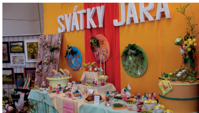
Návštěvníci se již teď mohou těšit na velikonoční výstavu.