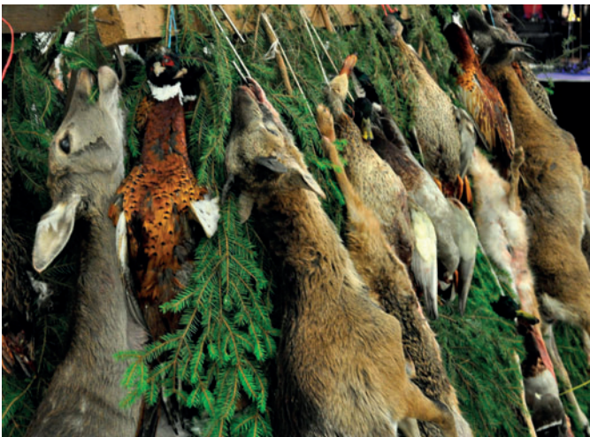
Pro návštěvníky plesu byla připravená bohatá tombola ze zvěřiny.

Druhý rok po sobě jsme ve spolupráci s vedením městyse Častolovice připravili i taneční zábavu pro veřejnost. Poslední leč druhou listopadovou sobotu navštívilo v sále kulturního domu U Lva v Častolovicích na 100 návštěvníků. Přípravy byly náročné, zajištění této akce také, výsledkem byli snad spokojení hosté tančící ještě dlouho po půlnoci. Všichni si mohli odnést kromě zážitků z tance při vynikajícím hudebním doprovodu skupiny Bíza band i výhru z bohaté tomboly, v níž nechyběla drobná zvěř, ale i muflončata, danče či selata divočáků.