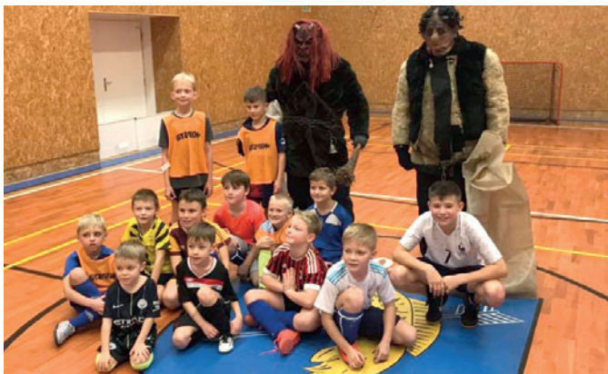
Mikulášský turnaj byl zakončen sladkou odměnou.