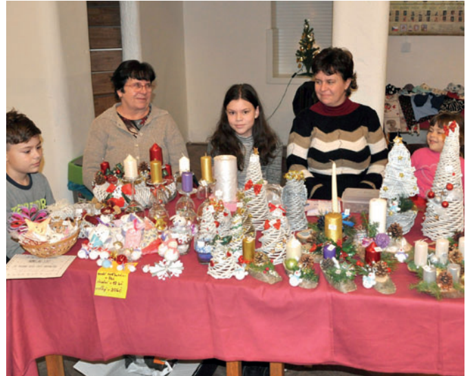
Předvánoční atmosféru navodil dětský jarmark s vlastnoručně vyrobenými výrobky.

Již počtvrté se 1. prosince od 14 hodin konal Dětský vánoční jarmark pořádaný kulturní komisí, tentokrát umístěný v sále U Lva. Ráno napadl první letošní sníh, což dodalo akci a prvnímu adventnímu víkendtu tu správnou atmosféru. Děti prodávaly krásné vánoční předměty převážně své vlastní výroby a kulturní komise dodala občerstvení v podobě horkých nápojů a cukroví. Velké poděkování patří zejména organizátorům, dětem a rodičům.