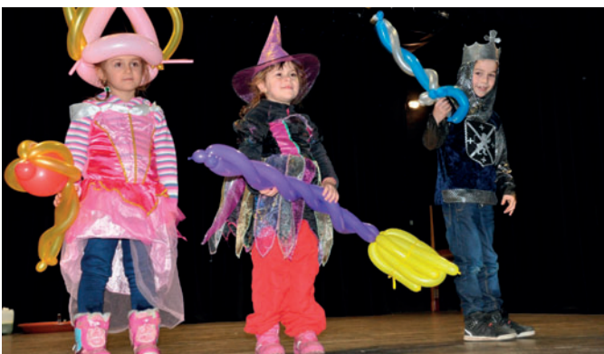
Kulturní komise si pro děti připravila mikulášské odpoledne.

Vystoupení Čertovské bublinovo-balonkové Láry Fáry se uskutečnilo v neděli 9. prosince od 16 hodin v sále U Lva. Na sále se kouznilo, vytvářely se bubliny, tvary z nafukovacích balonků a hrálo se divadlo, do kterého se zapojily i přítomné děti. Součástí akce byla i mikulášská nadílka pro děti. Akci připravila kulturní komise za podpory městyse Častolovice, obchodu Balla a svazu zahrádkářů. Bylo přítomno více než šedesát dětí.