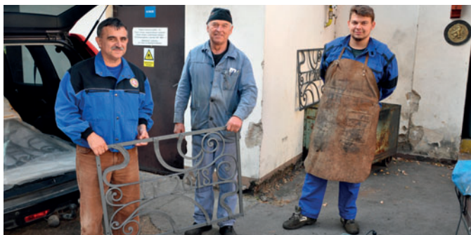
O výrobu ozdobného plůtku se postarali mistři a studenti z Jaroměře.

V úterý 23. října se uskutečnila jedna z kapitol příprav oslav 100. výročí Československé republiky. Členové Spolku přátel Častolovic instalovali v lesoparku u hřbitova ozdobný kovaný plůtek, do kterého byla v sobotu 27. října vysazena lípa svobody. Plůtek pořídil spolek ze svých prostředků jako dárek ke 100 letům republiky. Vyrobili jej mistři odborného vyučování a studenti Střední školy řemeslné v Jaroměři.