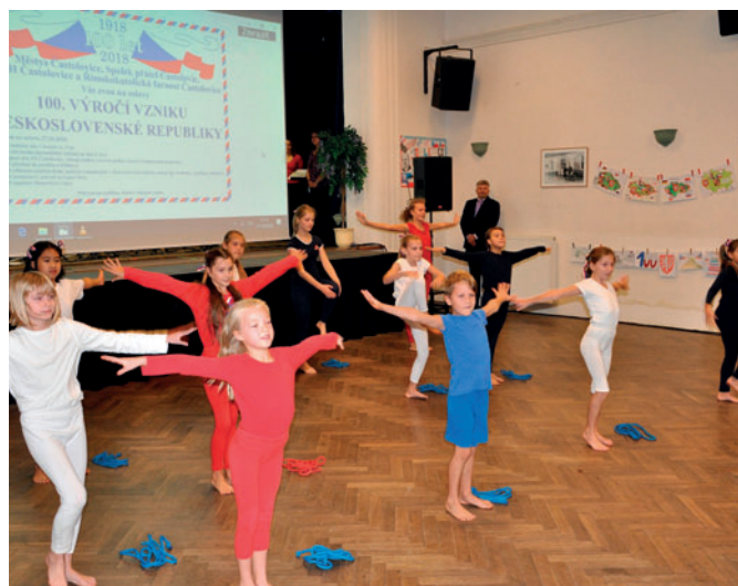
Při oslavách významného jubilea vystoupili žáci ze základní školy.