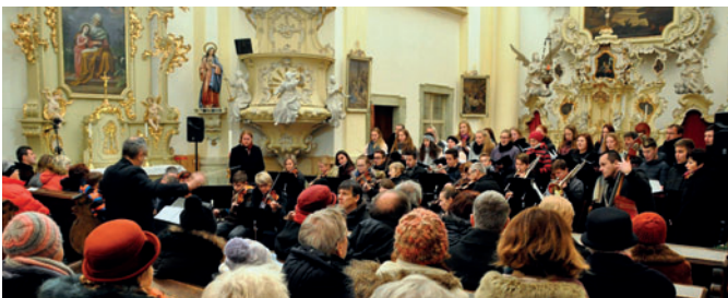
Při koncertu Rybovky byl kostel zaplněn do posledního místa.