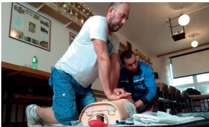
Členové JSDH absolvovali každoroční školení první pomoci.

Rok se s rokem sešel a členové jednotky postupně ve dnech 13., 14. a 20. října absolvovali školení kardiopulmonální resuscitace a použití ambuvaku, které pro nás zajišťuje ZZS Hradec Králové. Nabité vědomosti a znalosti jsme využili během dvou náročných zásahů v srpnu a listopadu loňského roku, při kterých obě osoby, i přes poskytnutou pomoc, bohužel zemřely. Je třeba si však uvědomit, že zásahy tohoto charakteru bývají statisticky úspěšné pouze u 20 % zachraňovaných.