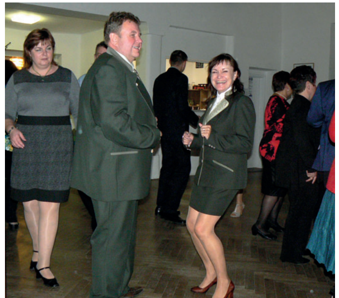
Manželé Cardovi si zaplesali na druhém ročníku mysliveckého plesu.

Tato taneční zábava opět ukázala, jak je pro obec důležité a potřebné mít pěkný sál a místo ke společnému setkávání a spojování lidí.