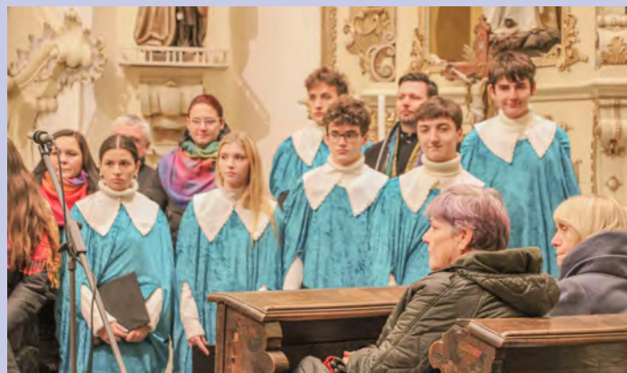
Česká mše vánoční Jana Jakuba Ryby rozezněla kostel sv. Víta.