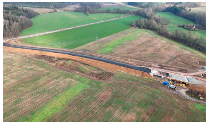
Pár fotografií z první části obchvatu Častolovic foceně z dronu.